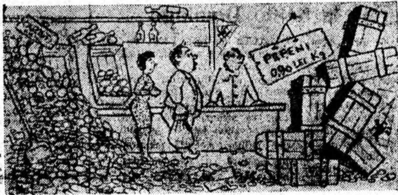
La unitatea O.L.F. nr. 12 din Lupeni curățenia lasă de dorit, iar unele mărfuri sînt greșit etichetate.

Este necesar ca direcția O.L.F. din Petroșani să ia neîntîrziat măsuri în această privință și să pună odată pentru totdeauna traburile la punct.