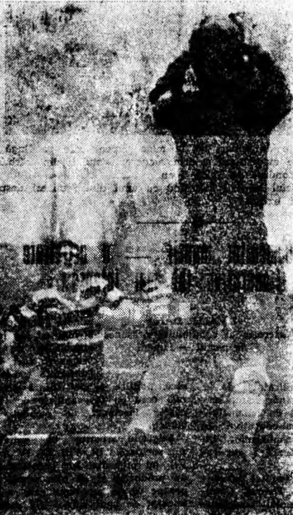
ÎN CLIȘEU: Un nou atac la poarta oaspeților.

Handbalistele de la Vulcan au jucat la Sebeș cu Textila. Deși la pauză au fost conduse cu 6-2, în final, ele au reușit să obțină un meritoriu rezultat de egalitate. Scor: 7-7.