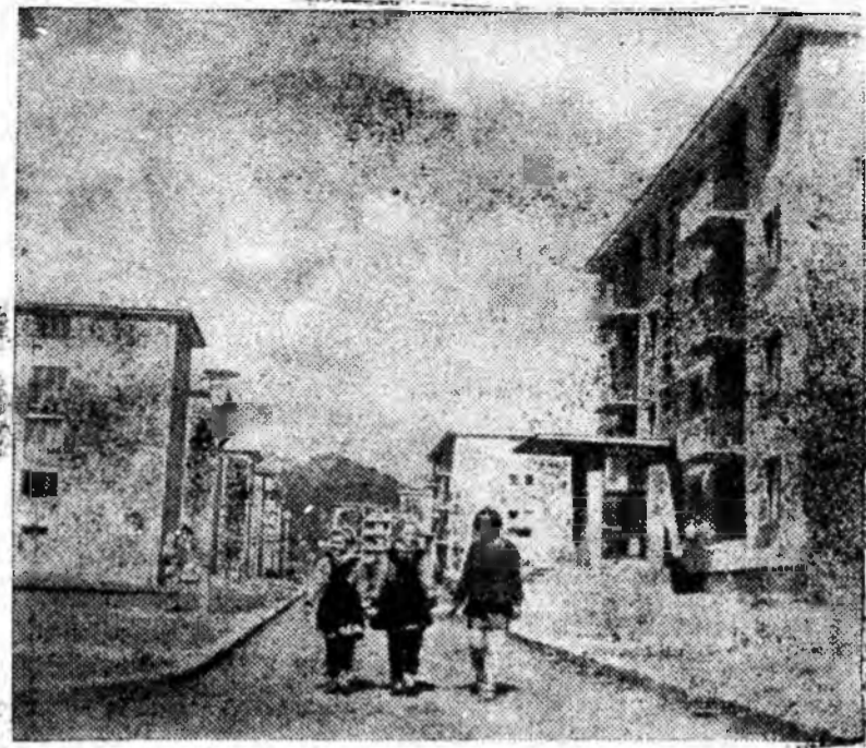
Vedere din noul cartier Livezeni al orașului Petroșani.

Odată cu lărgirea rețelei comerciale, unitățile de desfacere sînt dotate cu utilaje moderne. În prezent, în unitățile noastre funcționează 214 utilaje. Numai în acest an, unitățile comerciale din Valea Jiului au fost dotate cu 30 agregate noi, din care 15 vitrine frigorifice, 12 dulapuri frigorifice și altele.