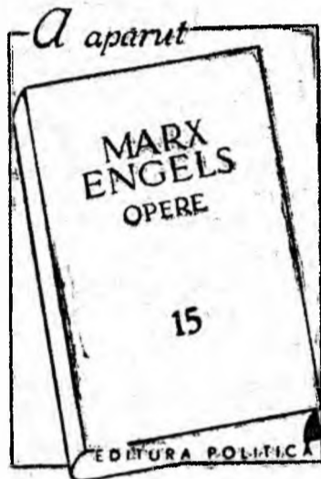
Volumul cuprinde lucrările scrise în perioada ianuarie 1860 — septembrie 1864.