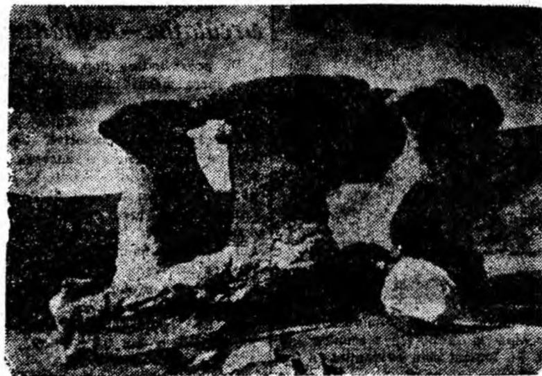
„Babele” în timpul toamnei.

Se apreciază că trei sau patru lămpi de acest tip plasate la o mare înălțime ar fi suficiente pentru a lumina perfect un mare oraș modern.