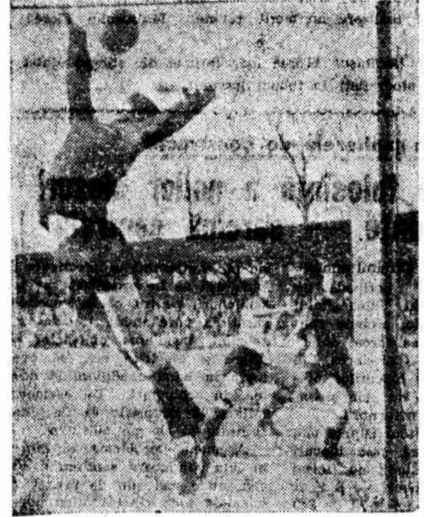
Un nou atac la poarta oaspeților