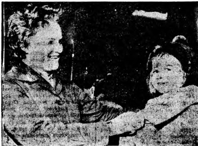
Odată cu venirea zilelor friguroase, magazinul de îmbrăcăminte pentru copii „Tăndărică” din Petroșani (unitatea nr. 4) e animat de un neîntrerupt dute-vino. Micilor, dar pretențioșilor cumpărători, vînzătoarele din raioane abia prididese să le satisfacă cerințele. Clișeul reprezintă un instantă nou din acest magazin.