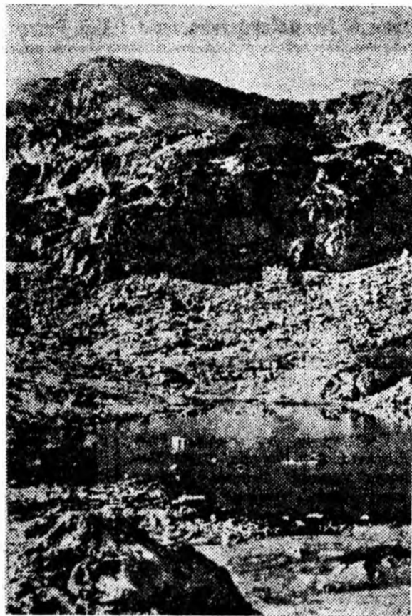
ÎN CLISEU: Vedere asupra lacului Stînișoara.

De asemenea, în acest anotimp, lipsa razelor calde de soare, a vegetației, a adierilor parfumate de miresme de flori este compen-