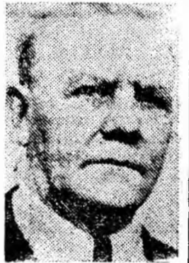
FORO IGNAT, Petrița