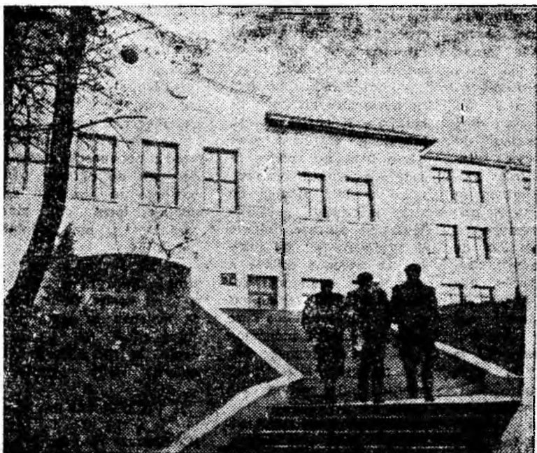
În drum spre Institutul de mine.