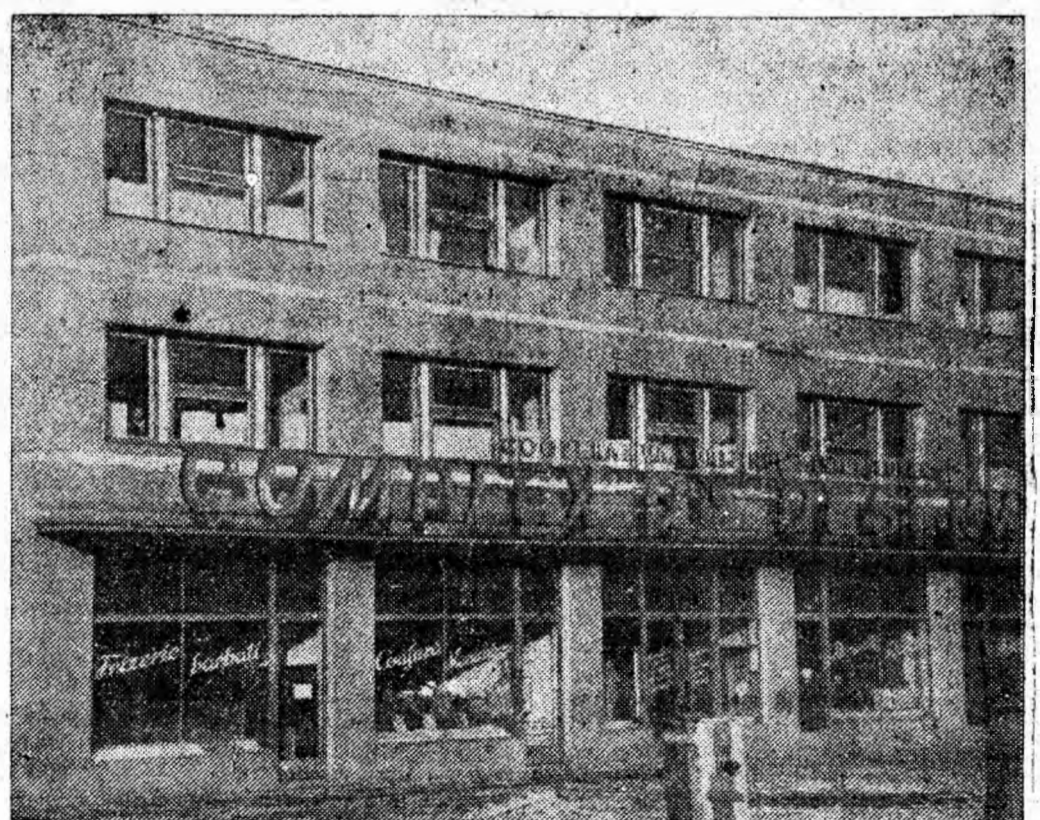
În ultimii ani constructorii din Lupeni au dat în folosință zeci de blocuri și noi spații comerciale. Cliseul înfățișează o nouă construcție modernă: Complexul de deservire.