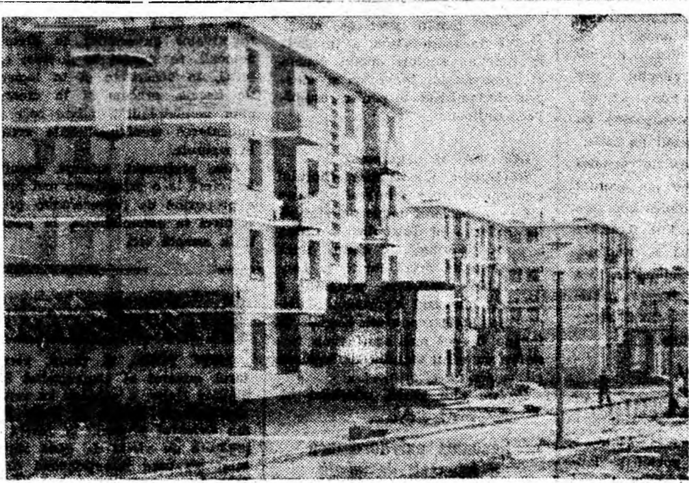
Cartierul Livezeni cuprinde în prezent peste 100 de blocuri, o școală cu 16 săli de clasă, unități comerciale. În anul viitor aici se vor ridica încă 20 blocuri, un nou complex comercial și alte construcții. IN CLUJ: Un aspect din acest cartier.

Luînd măsuri în comun, asemenea lucruri neplăcute ar putea fi evitate”. Ceea ce este adevărat.