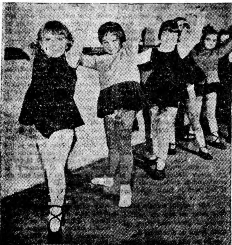
Viitoare balerine (Cele mai tinere eleve de la cercul de balet al clubului sindicatelor din Petroșani).