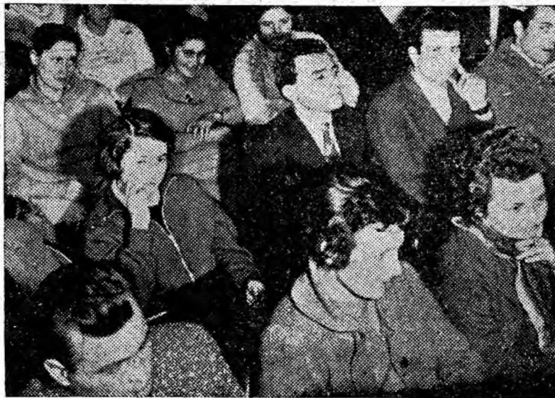
IN CLIȘEU: Aspect din sală.