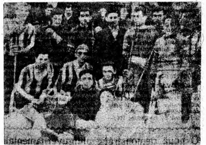
Pentru iubitorii hocheiului din Lupeni a devenit deja un lucru obișnuit să-și petreacă o parte a zilei de repaus pe patinoar. Aici se organizează cu regularitate întreceri de hochei și patinaj. Înaintea unui meci, hocheiștii au ținut să se fotografieze împreună.

Miercuri seara, pe cea mai înaltă treaptă a podiumului învingătorilor olimpici au urcat sportivii sovietici Ludmila Belousova și Oleg Protopopov, laureați ai probei de patinaj artistic (pe-rechi). Este pentru prima oară în istoria Olimpiadei Albe cînd un cuplu sovietic reușește să cucerească la patinaj artistic medalia de aur. Oleg Protopopov și Ludmila Belousova sînt soți. Ei fac parte din clubul sportiv „Lokomotiv” Leningrad.