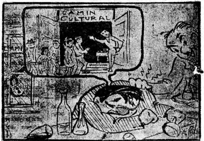
Între vis și... realitate.

Căminul cultural din Cîmpu lui Neag se află în centrul comunei. O coincidență fericită face însă ca alături de el să se afle bufetul T.A.P.L. Pe cînd acesta din urmă funcționează conform unui program bine întocmit, căminul cultural este lipsit de orice program. Lacătul de la intrare în cămin este un paznic neînduplecat, așa că deseori... locuitorii intră pe ușa alăturată.