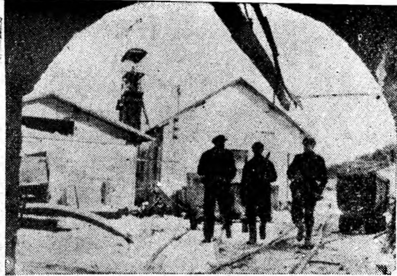
Drumul ce duce spre sectorul III-Piscu al minei Aninoasa, trece printr-un tunel lung de cîteva sute de metri. În clișeu, un grup de mineri intrînd în tunel. Tunelul e luminat electric și are o secțiune special amenajată pentru acel străbat, iar minerii la rîndul lor sînt înarmați cu nedespărțite lor lămpi.

În timpul scurt care a trecut pînă acum din acest an, la secția tratamente termice de la U.R.U.M.P. s-au efectuat lucrări ample de dezvoltare a capacității de producție. S-a construit un nou cuptor electric cu o capacitate sporită, două cuptoare de cimentare și un cuptor electric de recoacere. Prin intrarea în funcțiune a acestor cuptoare, capacitatea de producție a secției se triplează. Aceasta va asigura aplicarea tratamentelor termice corespunzătoare la un număr mult mai mare de piese, ceea ce va permite redimensionarea multor repere în scopul reducerii consumului de metal și creșterea duratei de funcționare a pieselor.