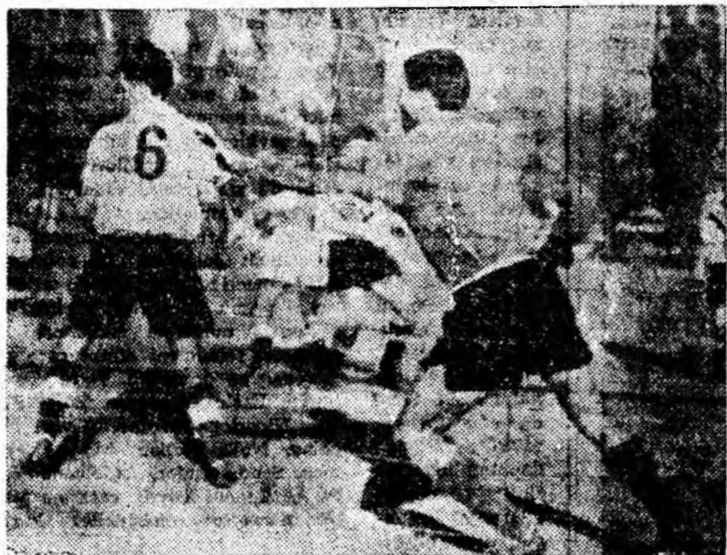
Faza din clișeu ne amintește despre unul din meciurile de anul trecut. În curînd însă va începe returul campionatului. Atunci iubitorii fotbalului nu se vor consola doar cu... fotografiile.

Clasamentul pe medalii al Olimpiadei de iarnă de la Innsbruck arată astfel: 1. U.R.S.S. 11 medalii de aur, 8 de argint, 6 de bronz; 2. Austria 4 medalii de aur, 5 de argint, 3 de bronz; 3. Norvegia 3 medalii de aur, 6 de argint, 6 de bronz; 4. Finlanda 3 medalii de aur, 4 de argint, 3 de bronz; 5. Franța 3 medalii de aur, 4 de argint; 6. Germania (echipă unită) 3 medalii de aur, 3 de argint, 3 de bronz; 7. Suedia 3 medalii de aur, 3 de argint, 1 de bronz; 8. S.U.A. 1 de aur, 2 de argint, 3 de bronz; 9. Olanda 1 de aur, 1 de argint; 10. Canada 1 de aur, 2 de bronz; 11. Anglia 1 de aur; 12. Italia 1 de argint, 3 de bronz; 13. R.P.D. Coreeană 1 de argint; 14. R.S. Cehoslovacă 1 de bronz.