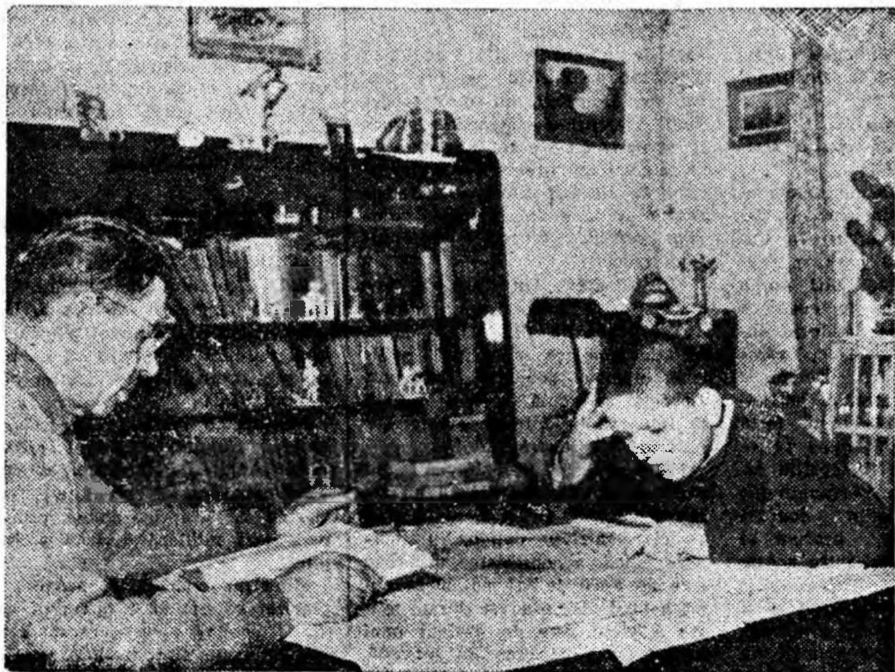
Într-un interior frumos și bine întreținut, viața ți-e mai dragă...

S-a constatat, de asemenea, că munca educativă dusă de grupele de partid și de comisiile de teme, a constituit un sprijin de nădejde acordat comitetelor de bloc în antrenarea locatarilor la acțiune. Bine venite au fost și constăturile finite, precum și folosirea gazetelor de perete ca mijloc de popularizare a rezultatelor obținute și de educare cetățenilor de a lăsa deoparte lipsurile din activitatea comitetelor de bloc. Există însă lipsuri serioase care se resimt din cauză că I.L.L. nu s-a ocupat îndeajuns de instituirea comitetelor de bloc, de reorganizarea celor descompletate și de înființarea lor acolo unde încă nu există. De asemenea, funcționarea defectuoasă a unor centrale termice, lipsa de apă caldă și pe alocuri chiar și de apă rece, apoi greutățile provocate de I.C.O. prin neridicarea la timp a resturilor menajere au produs nemulțumiri care s-au resimțit negativ asupra activității unor comitete de bloc care nu au avut inițiativa realizării legăturii cu I.L.L. și I.C.O. pentru lichidarea lipsurilor semnalate.