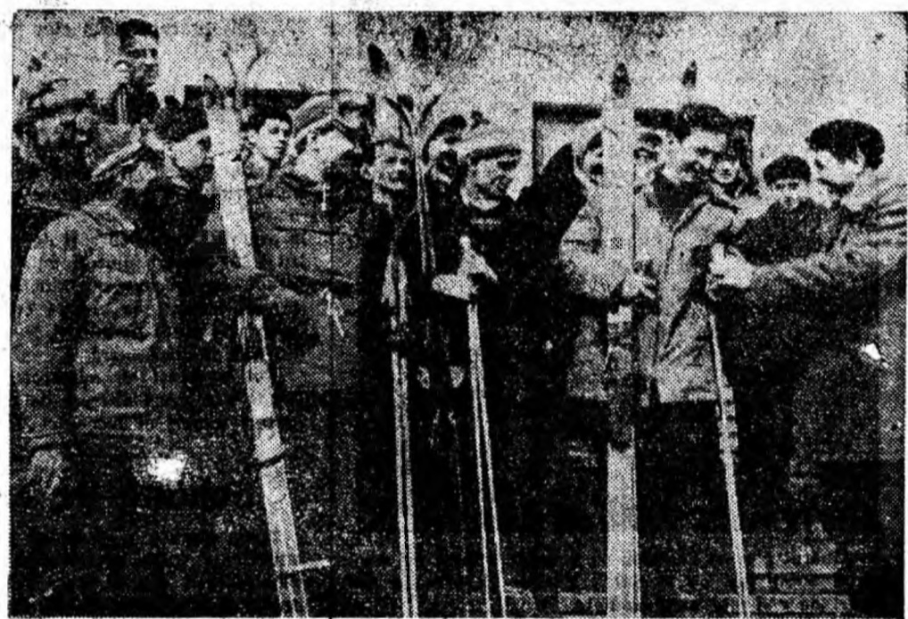
Concursul de schi s-a terminat. Înminarea cupelor aduce bucurie nu numai pe chipurile învingătorilor ci și pe a celorlalți concurenți.

Studenții au rezolvat problema suprimînd roțile. Ei vor duce pe rînd chiuveta în spinare în loc s-o împingă.