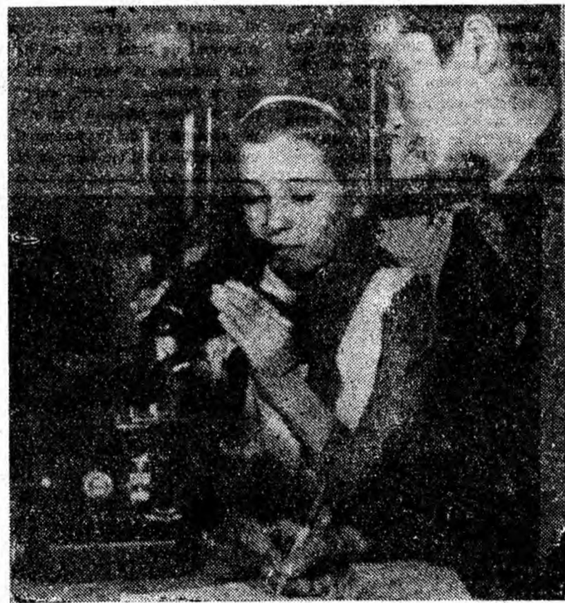
Orele de laborator la fizică sînt așteptate cu multă bucurie de elevi. Ele întregesc cunoștințele teoretice din timpul cursurilor.

Pentru a veni în sprijinul elevilor din clasele V—XI, care urmează cursurile școlii medii, secția fără frecvență și au de susținut în vară mai multe examene, la Școala medie mixtă din Petroșani se organizează între 1—8 martie examenele de presesiune. Inscrierile pentru examenele din această presesiune se fac pînă sîmbătă 29 februarie.