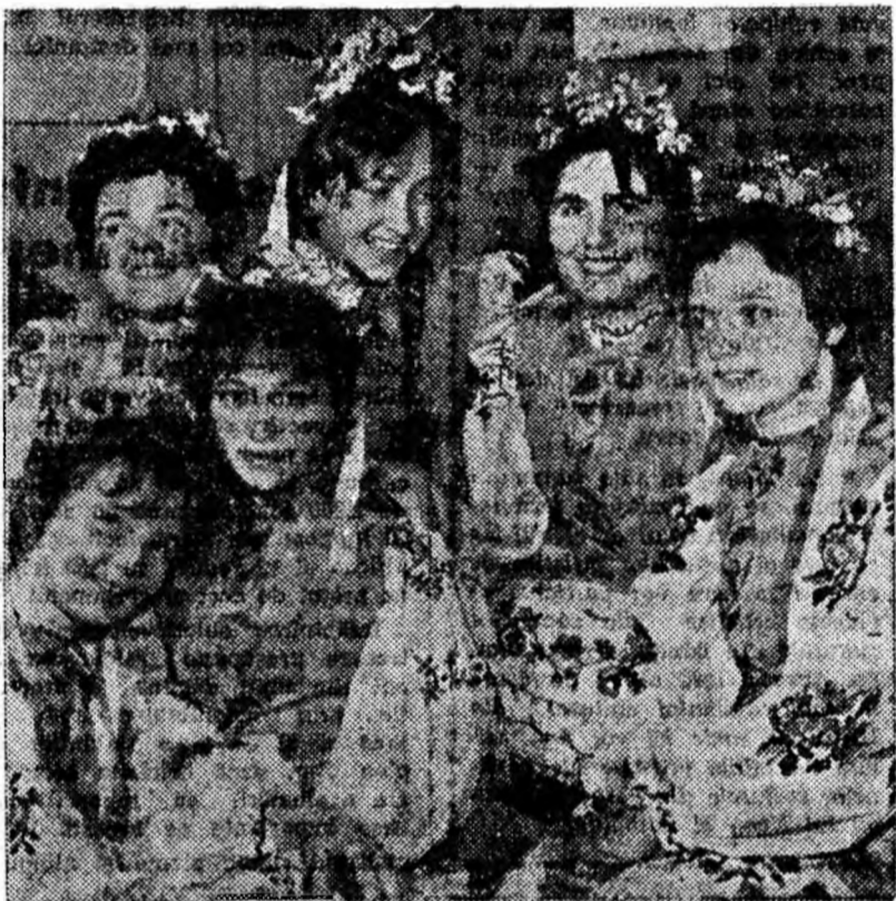
Un buchet de... flori.

Încălțămîntea și umbrela au avut și ele forme și culori variate de-a lungul veacurilor. De asemenea poșetele în formă de sac confecționate din stofă erau cunoscute de popoarele antice. În aceste poșete nu se găseau însă batisete; nasul se ștergea cu mîna. Dar această lipsă neînsemnată nu trebuie să ne facă să privim cu mai puțină admirație eleganța lumii antice. De fapt, modelele actuale reprezintă o simplă continuare a celor antice.