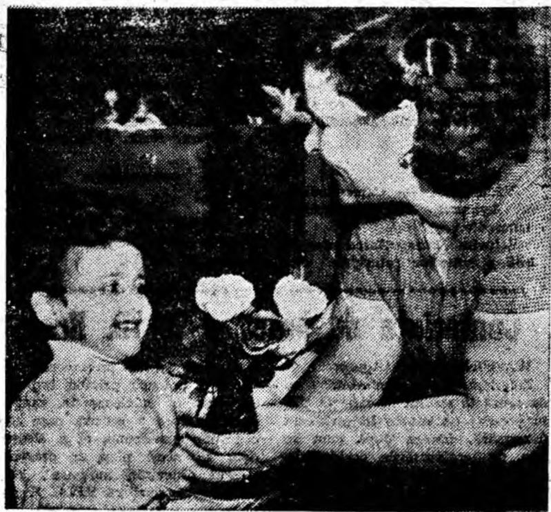
De ziua ta, mămică!