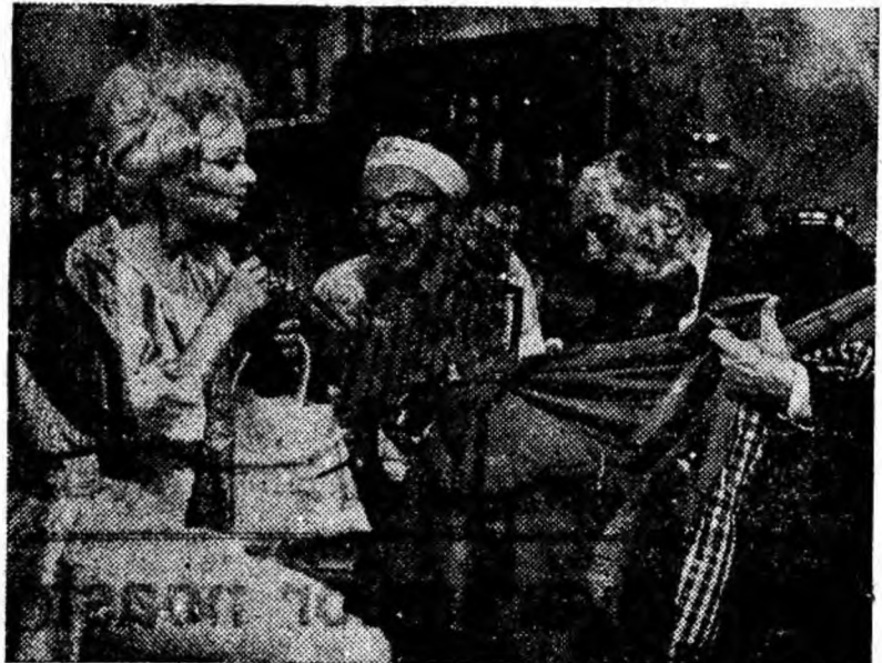
ÎN CLISEU O secvență din film.

În rolurile principale vor apărea actori de frunte ai țării noastre