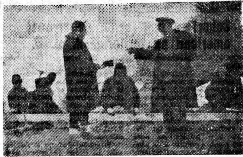
1) Inginerul șef al șantierului, tov. Paraschivescu Spiru, dînd indicații de lucru maistrului Dinescu Nicolae de la lotul Crivadia.