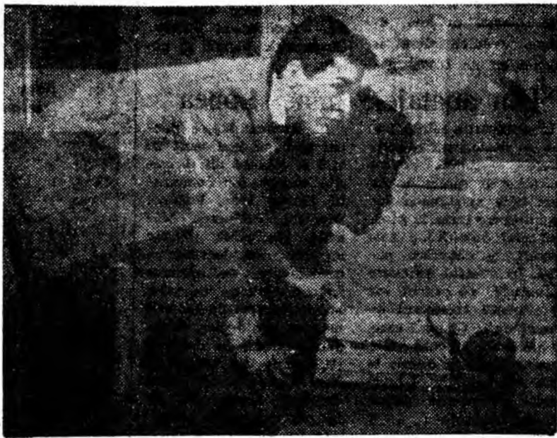
IN CLISEU: © secvență din film.

Filmul „Jurnalul Annei Frank” este o producție a studiourilor S.U.A. El va rula pe ecranul cinematografului „Republica” începînd de azi 15 martie.