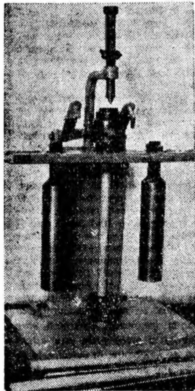
ÎN CLIȘEU: Aparatul realizat de colectivul de studenți.

Lucrarea constituie o aplicație practică a metodei oscilațiilor cuplate, inițiată de către tov. conf.