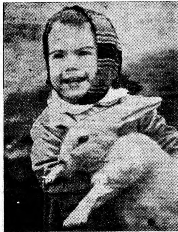
Prietenul meu iepurilă.

Învățătorul danez Ruby intenționează să dea în judecată pe omonimul său — asasinul lui Oswald. După cum se știe, numele adevărat al „protagonistului” procesului de la Dallas este nu Ruby ci Rubinstein. Învățătorul danez afirmă că folosirea numelui de Ruby aduce prejudicii familiei sale cît și altor 50 de familii daneze, care poartă același nume.