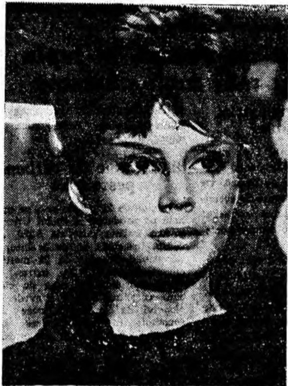
IN CLIȘEU: O secvență din film.

„Icarie X-B1” — producție a studioului din Barandov (R. S. Cehoslovacă), este un film de aventuri științifico-fantastice care anticipează una din cuceririle viitorului: zborul omului pe alte planete.