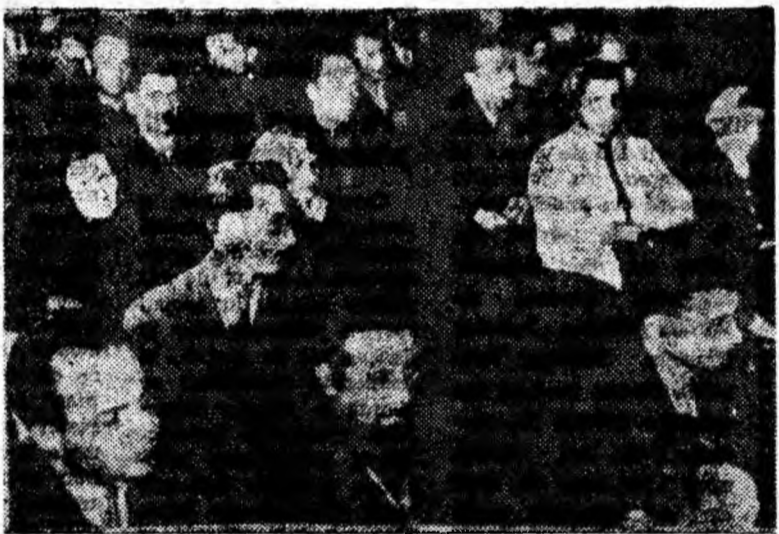
Aspect din sala de festivităţi a clubului C.C.V.J., în timpul sesiunii a XIX-a a Sfatului popular orăşenesc Petroşani.

• Acţiunile patriotice pentru crearea zonelor verzi trebuie împlinite strâns cu munca constructorilor. Lucrările trebuie astfel organizate ca în noile cartiere ce se construiesc în oraşele Petroşani, Lupeni şi Petriţa, odată cu înisajele, să fie terminată şi amenajarea terenurilor înconjurătoare.