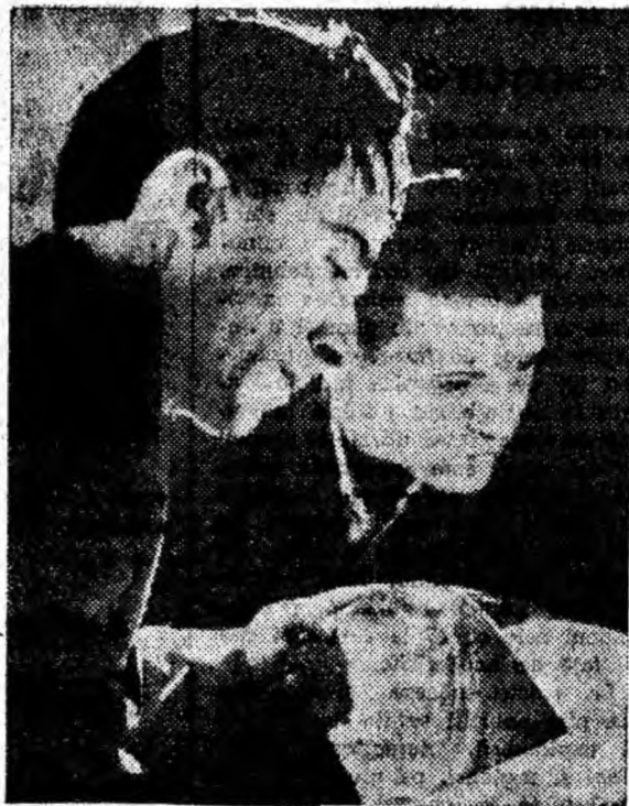
În sala de lectură a clubului sindicatelor din Lupeni.

P.S. Răspundeți-ne cit mai neîntîrziat pe adresa teatrului.