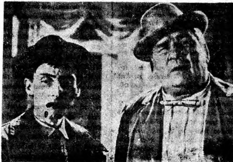
ÎN CLIȘEU: © secvență din film.

Filmul „Hoții din San Marengo”, o producție a studiourilor „DeFa”-Berlin (R.D.G.), rulează începînd cu data de 31 martie.