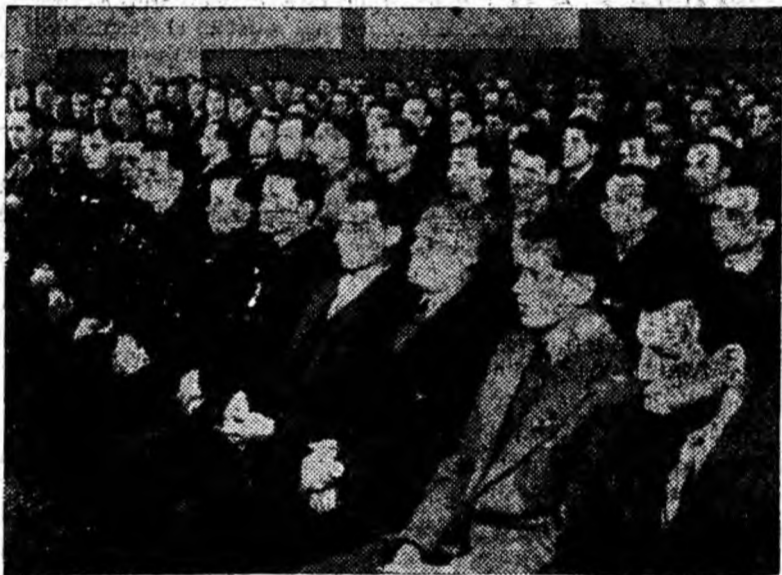
Aspect din sala de festivități