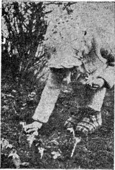
Bucurii de primăvară.

Prin librăria noastră din Petroșani au fost vândute în primul trimestru din acest an cărți în valoare de aproape un sfert de milion de lei, mai mult față de aceeași perioadă a anului trecut cu aproape 14 la sută. De remarcat că aproape 60 000 de lei din valoarea cărților vândute s-au realizat prin cele 32 de standuri de cărți organizate în întreprinderile și instituțiile din orașul Petroșani.