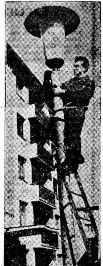
Se montează o nouă lampă de neon.

Recent, au sosit cu avionul la Paris din Alaska 24 de crabi uriași, de 1,5 metri diametru, destinați muzeului oceanografic din Monaco. Crabii uriași vor fi instalați într-un bac frigorific, amenajat special în acest scop.