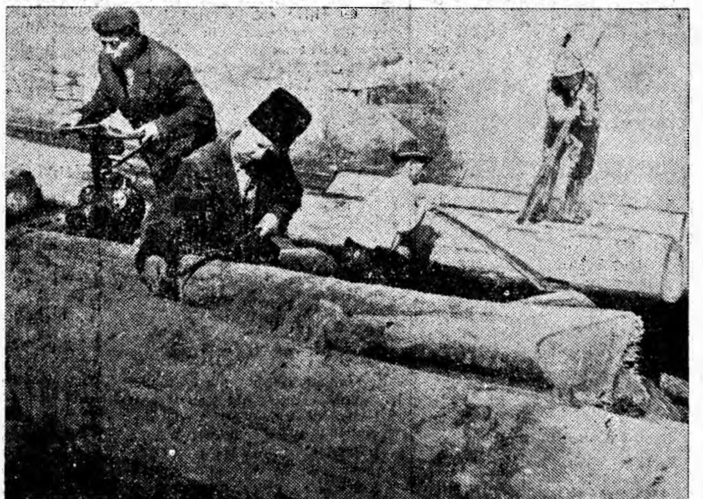
Aspect de muncă de la depozitul de lemn din gara Banița. Muncitori forestieri din cadrul I. F. Petroșani pregătesc buștenii pentru expediere.