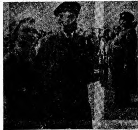
O secvență din film.

Pe ecranul cinematografului „7 Noiembrie” din Petroșani filmul va rula începînd cu data de 15 aprilie.