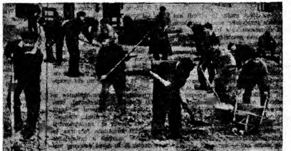
Tinerii participă activ la acțiunile patriotice de înfrumusețare a străzilor și curțiilor orașului nostru.

ÎN CLUȘEU: Un grup de tineri de la Școala profesională Petroșani amenajează un teren pentru ronduri cu flori.