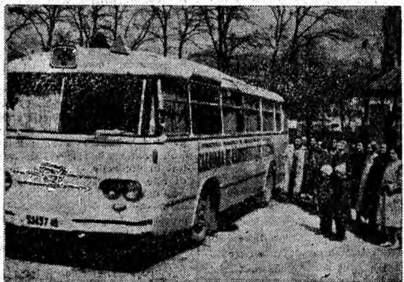
În jurul caravanei care transportă aparatele moderne de control a stării de sănătate a populației.