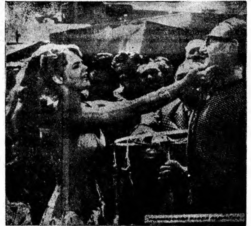
O secvență din filmul „Domnișoara Barbă Albastră” ce va rula pe ecranul cinematografului „7 Noiembrie” începînd din 25 aprilie a. c.