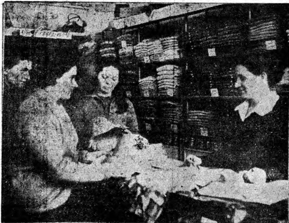
Aspect din magazinul de mercerie—galanterie și articole cosmetice, deschis de curînd în cartierul Viseoza din Lupeni.