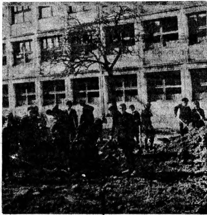
In aceste zile în orașul Vulcan au loc numeroase acțiuni de muncă patriotică. Zeci de tineri și tinere participă la acțiunile de înfrumusețare a orașului.

Dar oare preocupare au avut? Trebuia să aibă, mai ales că în fiecare lună au fost plătite 2 300 lei drept amortizări pentru atelierul mobil. Și totuși n-au avut. Inactivitatea atelierului mobil se face simțită la fiecare exploatare forestieră. Sperăm că măcar acum, primăvara, se vor trezi din amorțeață și cei în cauză, iar atelierul imobilizat va deveni mobil — așa cum îi este denumirea.