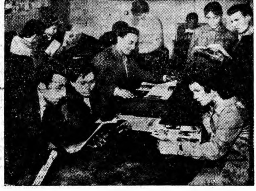
În sala de lectură