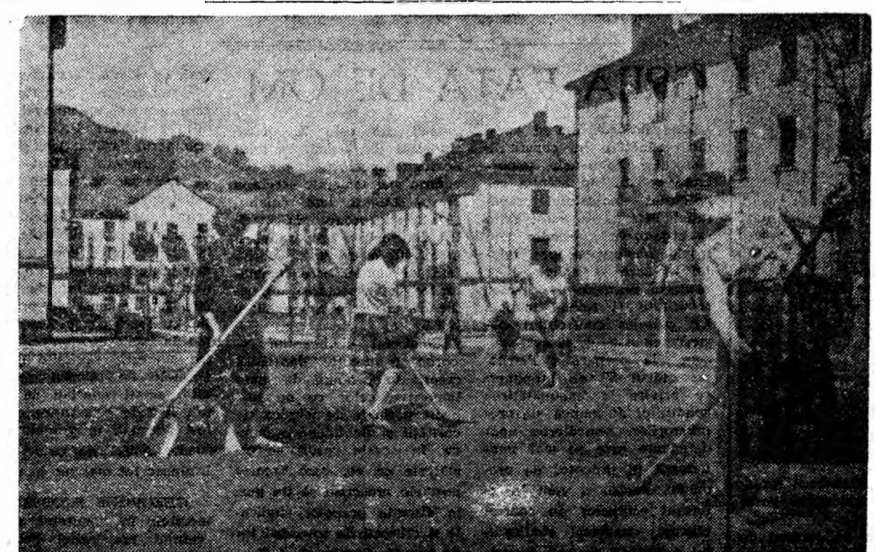
La Lonea, în cartierul Mihail Eminescu. Aici vor crește flori, se va întinde covorul ierbii...