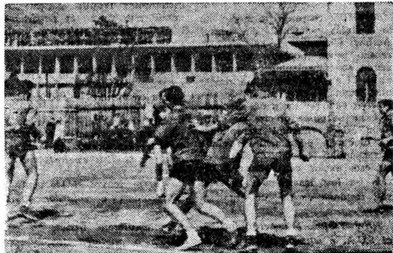
ÎN CLISEU: O fază din întîlnire.

Le urăm succes și am dori să le putem spune „Bine băieți!” așa cum le-am spus și duminică și de altele ori cu alte ocazii cînd au obținut succese ce au ridicat prestigiul Școlii medii din Petroșani. C. DUMITRU