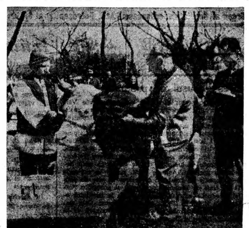
În satele Văii Jiului se desfășoară în prezent, sub îndrumarea Consiliului agricol, o acțiune pentru depistarea, combaterea și lichidarea tuberculozei la animale. Acțiunea, sprijinită efectiv de sfaturile populare, de deputați, se desfășoară cu succes. Tot în cadrul acestei acțiuni se face și vaccinarea anticărbunoasă a vitelor.

Această inițiativă deosebit de utilă trebuie însușită de celelalte sfaturi populare din Valea Jiului, deoarece ea contribuie la educarea copiilor în spiritul respectului față de munca depusă pentru gospodărirea localităților, pentru păstrarea zonelor verzi și a curățeniei.