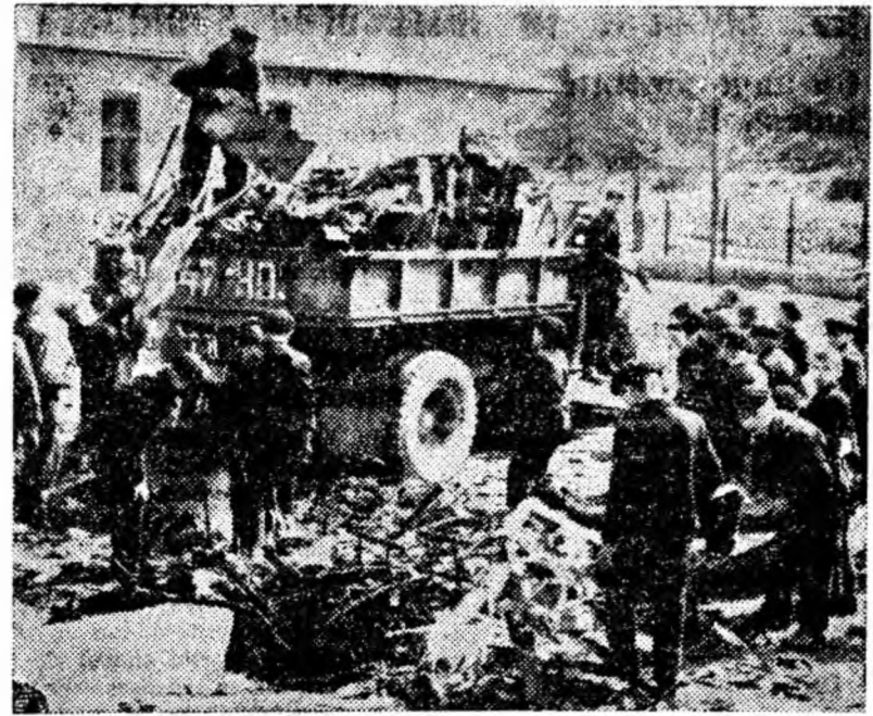
De curînd, Comitetul orașenesc U.T.M. Petroșani a organizat o zi de colectare a fierului vechi. La această acțiune o contribuție de seamă au adus-o și elevii școlilor medii și de 8 ani. Elevii Școlii de 8 ani nr. 3 din Petroșani, (în clișeu), de exemplu, au colectat într-o singură zi 5000 kg fier vechi pe care apoi l-au predat I.C.M.