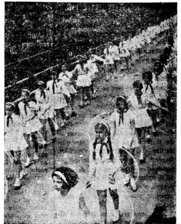
Prin fața tribunei trece un buchet de tinerețe. Sînt viitoarele gimnaste ale Văii Jiului.