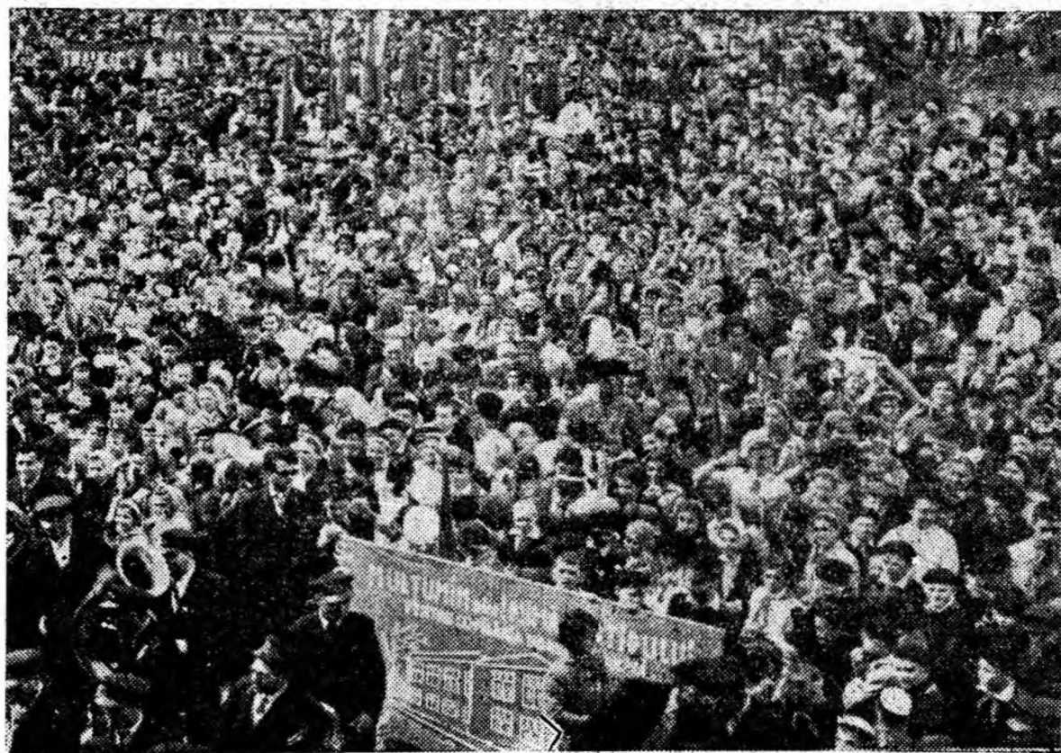
În Piața Victoriei, la mitingul de 1 Mai.

În Republica Populară Romînă s-a făurit și se consolidează unitatea morală politică a întregului popor; alături de clasa muncitoare, pășesc tărînimea colectivistă, intelectualitatea nouă, călăuzite de aceleași țeluri și idealuri.