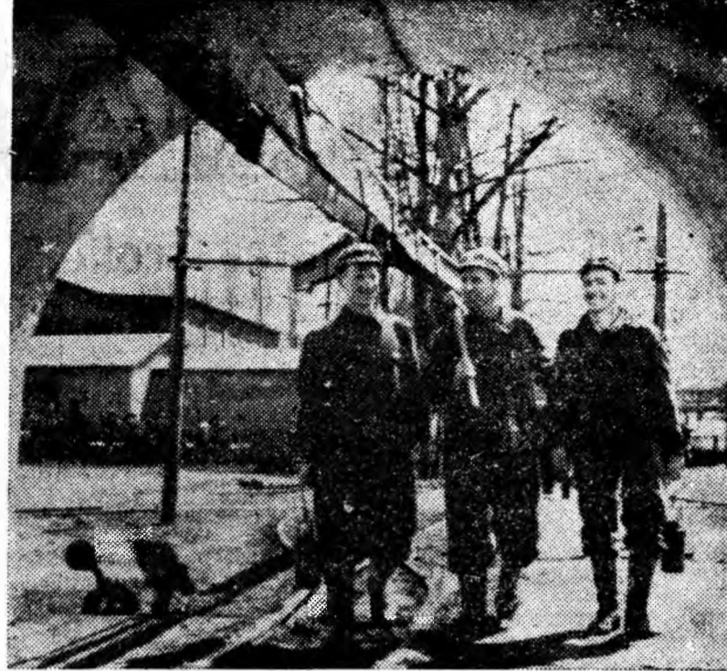
La intrarea în șut.