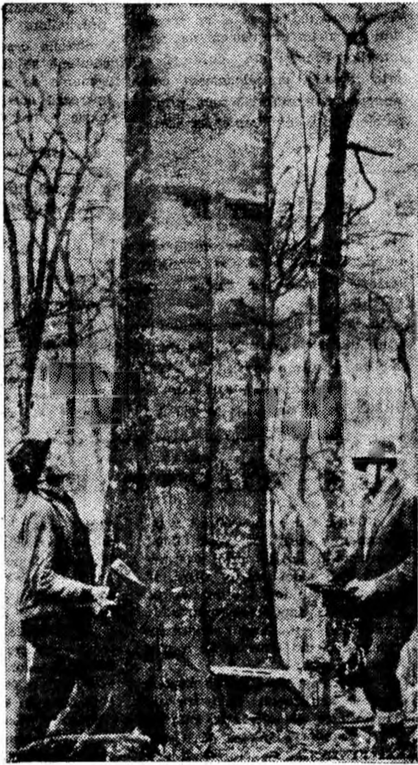
Tinerii muncitori forestieri din exploatarea Polatiște participă activ la întrecerea pentru valorificarea superioară a masei lemnoase.