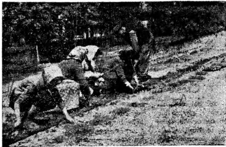
Se lucrează la amenajarea parcului.

glli, care au fost așternute în parc creîndu-se o zonă verde plăcută. Salariații sectorului în frunte cu grădinarii au amenajat ronduri unde au fost sădite mii de flori din sera sectorului I.C.O., iar în jurul parcului s-au plantat arbuști ornamentali.