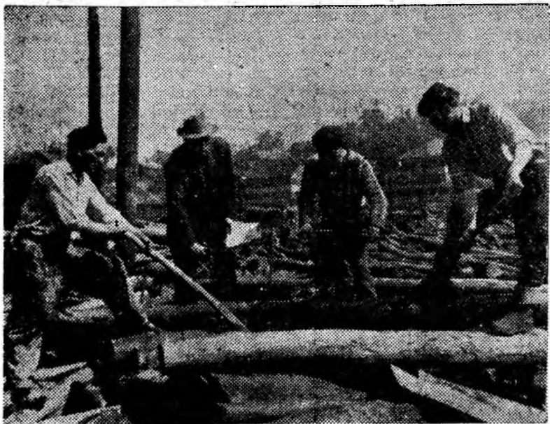
În gara mică — Petroșani — muncitorii forestieri încarcă un nou lot de bușteni în vagoane.