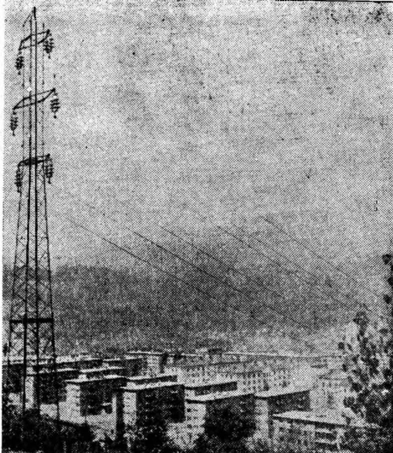
Vedere parțială din noul cartier Braia-Lupeni