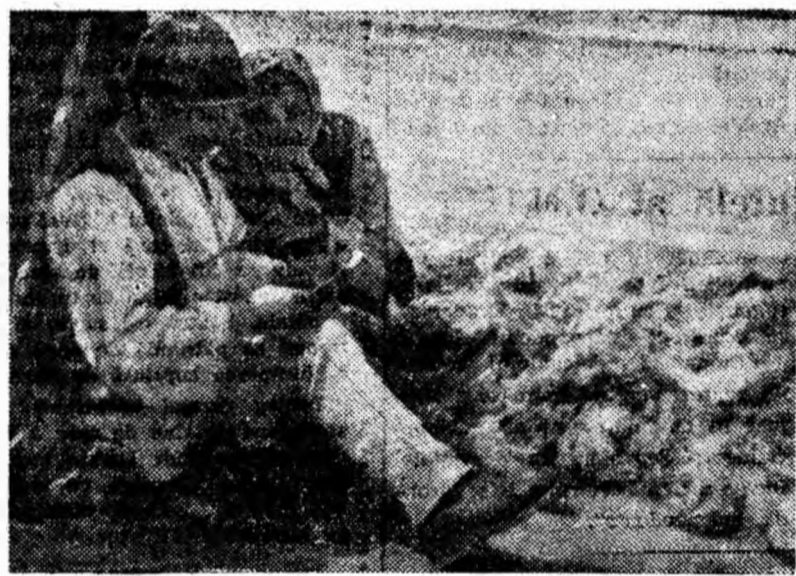
La centrul de colectare a linii — Lonea.

Rezultatul activității lor este deosebit de frumos: realizarea ritmică a sarcinilor de plan pe fiecare lună, iar acum scoaterea a 700 mc bușteni și 2.500 m steri lemn de foc în numai cîteva săptămîni. Sînt numai o mină de oameni din cadrul sectorului forestier Lonea, dar ca ei mai sînt mulți aici.