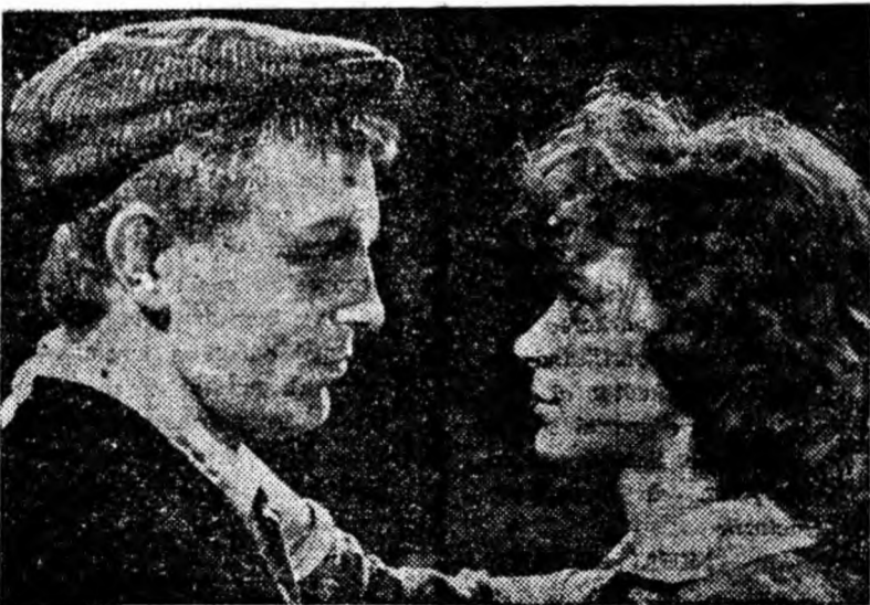
O scenă din film

Filmul „A treia repriză”, o producție a studioului „Mosfilm” rulează de ieri pe ecranul cinematografului „7 Noiembrie” din Petroșani.