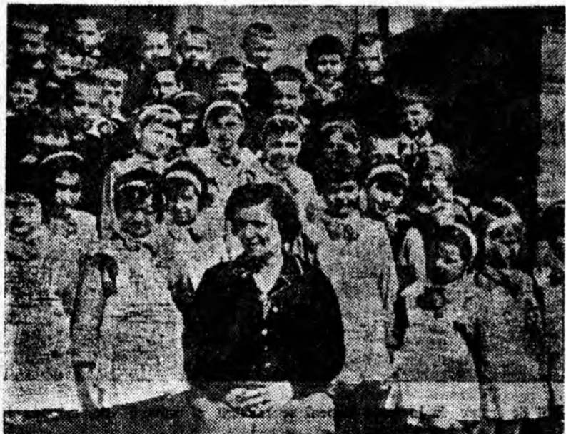
Atenție... gata! Și totoreporterul a apasat pe declanșatorul aparatului fotografic imortalizînd pe peliculă o amintire care nu se va uita: elevii clasei I-a A de la Școala generală de 8 ani nr. 4 din Petroșani, împreună cu învățătoarea lor, în ultimele zile de școală.