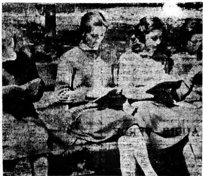
Ultimele zile de școală. Elevii școlilor medii și de 8 ani se pregătesc pentru încheierea cursurilor. În aceste zile activitatea este mai febrilă: se face recapitularea materiei parcurse, se corectează notele. Zilele călduroase din ultimul timp au permis să se poată studia în mijlocul naturii.

Problemele discutate de sesiunea sfatului popular au fost deosebit de importante. Învățăminte culese, hotărârile luate vor contribui la rezolvarea problemelor complexe ce stau în fața școlii în această etapă. C. COTOSPAN