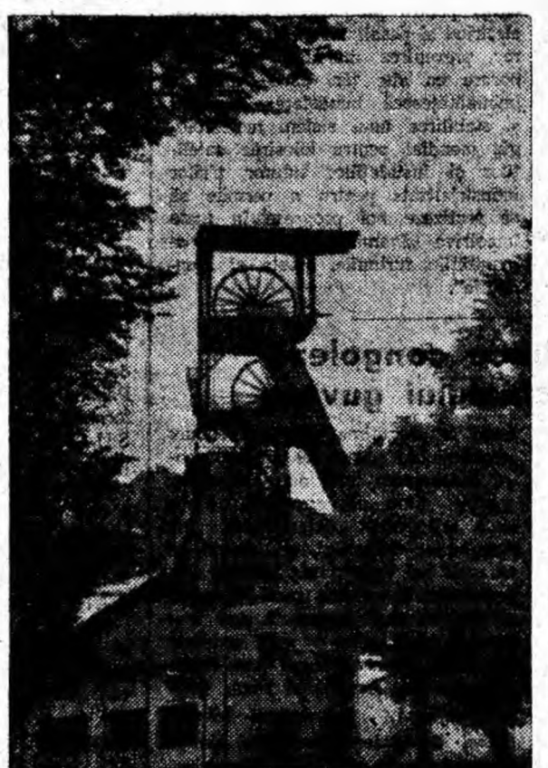
Drumul cărbunelui extras de minierii de la Aninoasa trece și prin puțul principal al exploatarei (în clișeu).