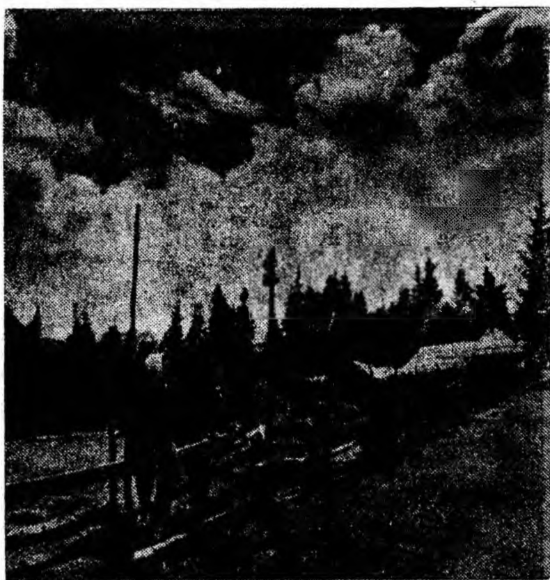
În drum spre cabana Gimpu lui Neag