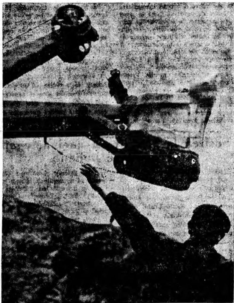
Excavatorul — puternică mașină de fabricație românească — aduce un sprijin însemnat în ușurarea muncii de pietrarilor de la Bănița.

Sectorul VII — investiții are create deci foarte bune condiții pentru îndeplinirea integrală a sarcinilor ce-i revin, pentru atingerea unor indicatori cit mai ridicaiți. Rămîne însă ca atenția colectivului, îndeosebi a conducerii tehnice, să fie îndreptată și în viitor asupra concentrării producției și creării condițiilor tehnico-materiale necesare brigăzilor pentru ca fiecare să-și realizeze ritmic sarcinile de plan. Mai multă inițiativă și perseverență se cere din partea colectivului sectorului de investiții în vederea asigurării unor înaintări rapide. În această privință s-a făcut încă prea puțin. Iată o rezervă de primă însemnătate care, valorificată, va asigura colectivului posibilitatea să fie mereu în avans cu lucrările de investiții.