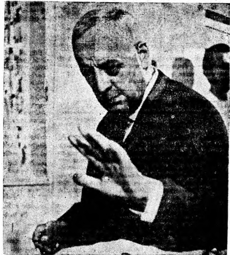
Scenă din film

Omul care pînă acum privise oamenii numai cu ochii chirurgului, înțelege marea importanță a griji față de om, a preocupării continue față de cei din jur.