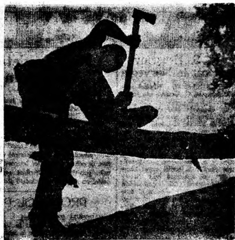
La fasonatul buștenilor în parchetul Cimpu Mielului din apropierea Uricaniului.