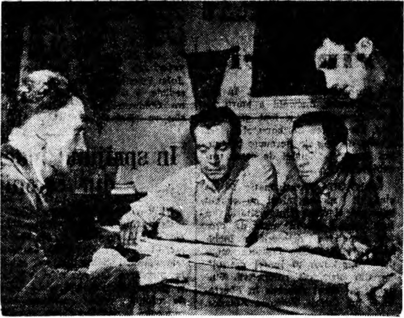
Biroul organizației de bază stabilind problemele care urmează să fie dezbătute în cadrul unei viitoare adunări generale.

— Faptul că organizația de bază din sector s-a întărit lună de lună cu noi membri și candidați de