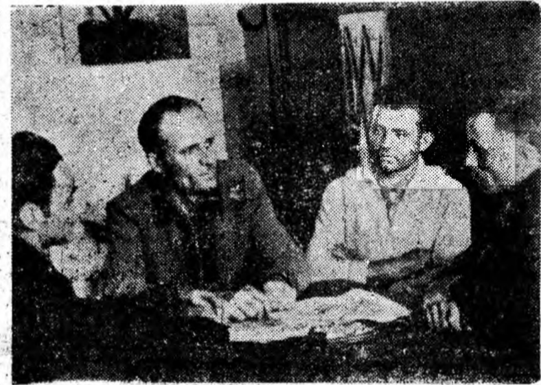
O parte din biroul grupei sindicale și cîțiva mineri înaintea de adunarea grupei sindicale.