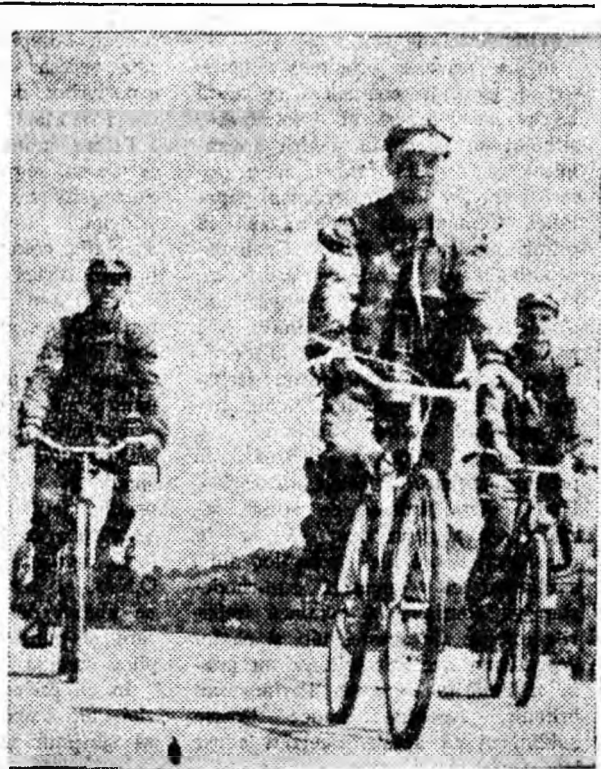
Uricani: În drum spre mîdă.

PETROȘANI — 7 NOIEMBRIE. Cei trei mușchetari; REPUBLICA. Cei trei mușchetari; LONEA: Germania, steluțele tale; PAROȘENI: Povestea unei nopți străni; BĂRRATENI: Orașul proștilor.