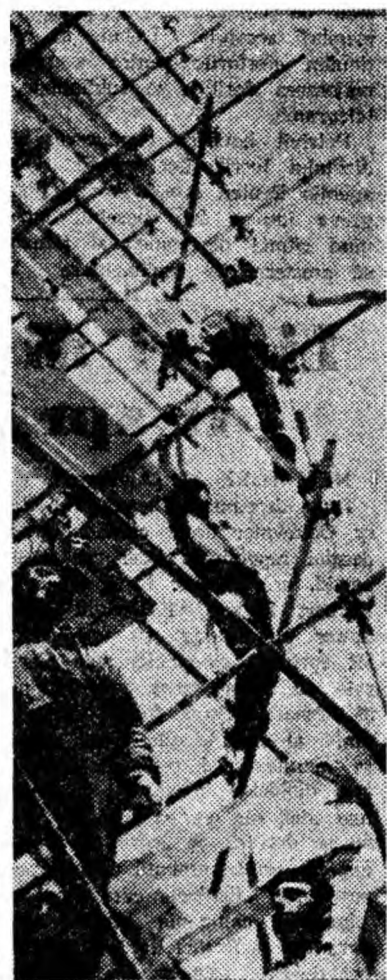
Oameni pe schele.