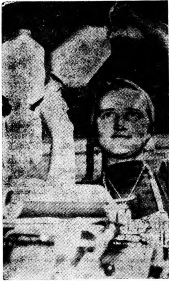
— Da! Fire de calitate bună. O spune chiar zîmbetul și privirea filatoarei.