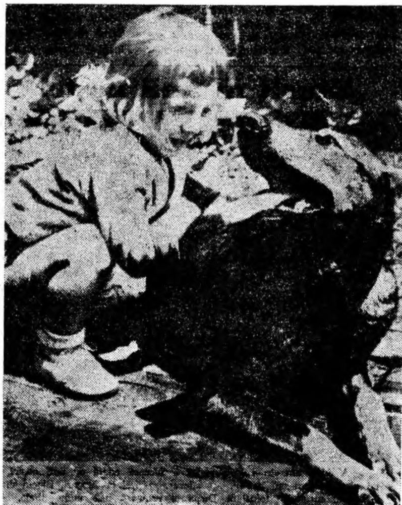
Prieteni de joacă.

Oamenii de știință din Leningrad au prezentat cîteva proiecte îndrăznețe ale viitoarelor orașe arctice. Unul din aceste proiecte înfățișează imaginea unui oraș cu o suprafață de 7,5 ha, deci e prevăzut pentru o populație de 10 000—12 000 de locuitori. O cupolă din material plastic va acoperi centrul orașului, aidoma unui acoperiș urias. Sub protecția acestuia se vor amenaja un parc, terenuri de sport, o bibliotecă, un cinematograful. E prevăzut ca orașul să aibă trei străzi, la rîndul lor, foarte originale; acoperite cu material plastic, ele se vor transforma în galerii largi, înalte și luminoase de-a lungul cărora se vor construi 16 clădiri de formă cilindrică. Instalații de climă artificială vor pune pe locuitorii orașului la adăpost de cele mai cumplite geruri. Sub cupola orașului arctic, temperatura nu va cobori niciodată sub 10 grade plus.