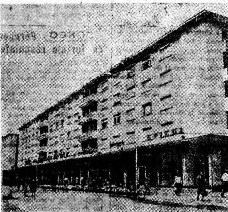
Pe zi ce trece, Bacăul se transformă într-un oraș modern, o adevărată capitală a unei regiuni care se industrializează rapid. Noile blocuri de locuințe schimbă fața orașului, dîndu-i monumentalitate.