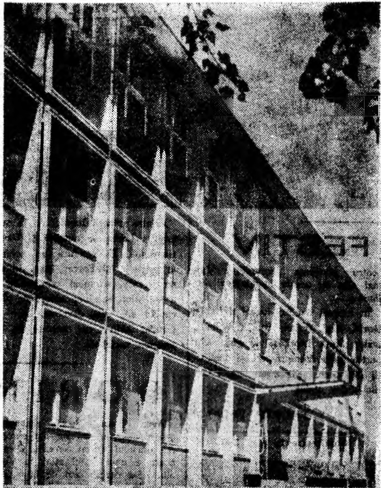
ÎN CLIȘEU: Clădirea noii școli cu 16 săli de clasă din orașul Vulcan, la care se efectuează acum ultimele lucrări de finisaj. O nouă expresie a grijii pe care partidul și guvernul o poartă fiilor oamenilor muncii.

Prin urmare, este cazul ca amenajarea noii săli de clasă pentru școala generală de 8 ani din Cîmpu să fie privită cu mai multă răspundere. Lucru pe care tovarășii de la sfatul popular din Petrila îl puteau deduce și din faptul că nici acum nu a fost rezolvată problema fondurilor necesare lucrărilor de amenajare a acestor săli de clasă.