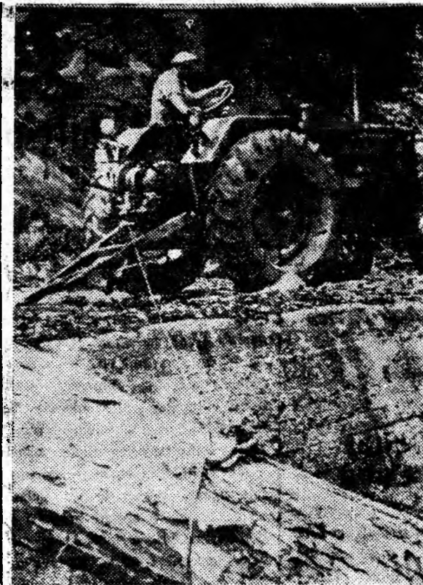
Bușteanul a alunecat în albia pîrului Polatiște. Lemnul este însă prețios: de aceea, tractoristul intervine cu succes și scoate bușteanul din apă cu ajutorul trolului autoîncărcător.